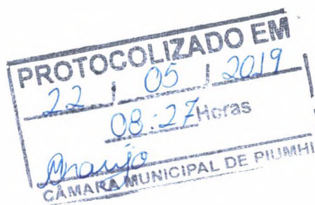
ADEBERTO JOSÉ DE MELO Prefeito