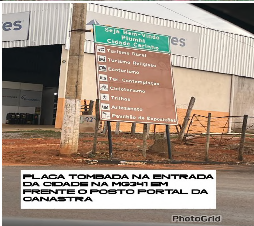
PLACA TOMBADA NA ENTRADA DA CIDADE NA MG341 EM FRENTE O POSTO PORTAL DA CANASTRA