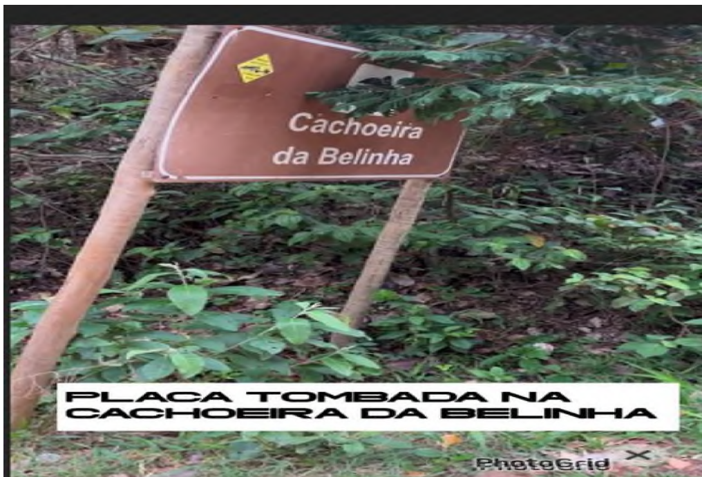
PLACA TOMBADA NA CACHOEIRA DA BELINHA

E-mail: apoio@camarapiumhi.mg.gov.br Telefone: (37) 3371-1551 / 1384