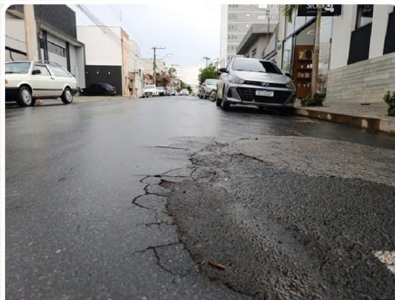
Rua: Francisco Soares dos Santos 📍

23mm f/1.6 1/120s ISO160 13/10/2025 16:53