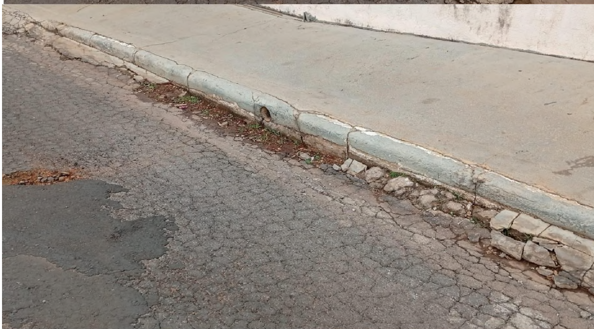
Rua Lenir Soares Nº 184