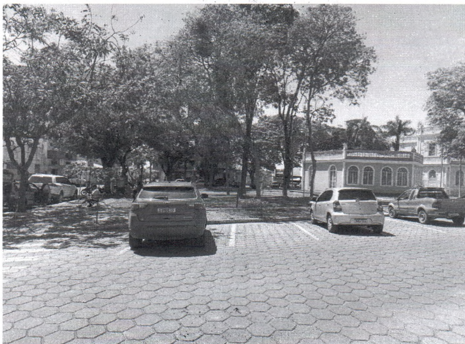
Entorno da Praça do Rosário

PROTOCOLIZADO EM 31/10/2025 às 08:38 horas Amélio CÂMARA MUNICIPAL DE PIUMHI