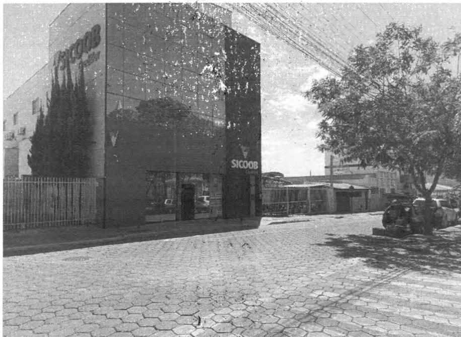
Rua Miguel Couto

Solicitação de demarcação de vagas de estacionamento exclusivas para idosos e pessoas com deficiência na Rua Miguel Couto, proximidades do nº 351, ou no entorno da Praça do Rosário.